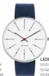
LEDERBAND NAVY BLAU

53101-1603 | 34 MM € 249 53102-2003 | 40 MM € 269 53103-2203F | 46 MM € 269 DAMENBAND