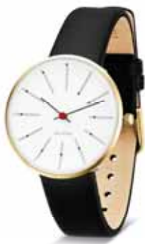
BANKERS GOLD - 34 MM Lederband schwarz 53107-1601 € 299