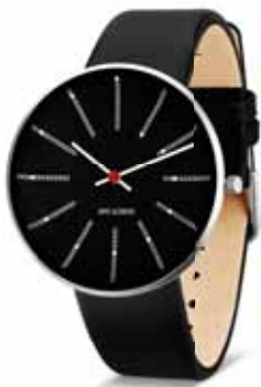
BANKERS BLACK - 40 mm Lederband schwarz 53105-2001 € 269