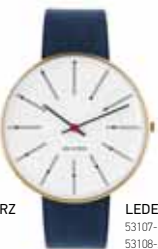
LEDERBAND NAVY BLAU

53107-1601 | 34 MM € 299 53108-2001 | 40 MM € 299