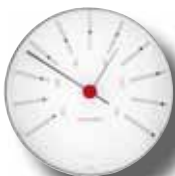
BANKERS - BAROMETER 120 MM 43686 | € 109