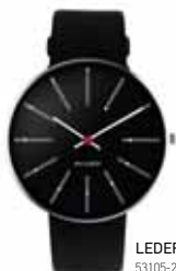
LEDERBAND SCHWARZ 53105-2001 | 40 MM € 269