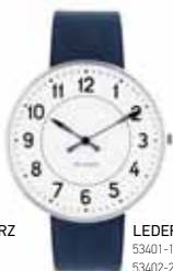
LEDERBAND NAVY BLAU

53401-1601 | 34 MM € 249 53402-2001 | 40 MM € 269