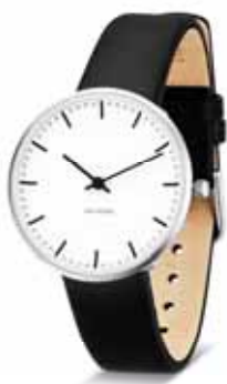
CITY HALL - 34 mm Lederband schwarz 53201-1601 € 249