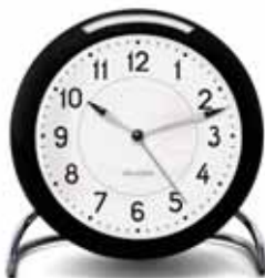
STATION 43672 | 110 mm € 95