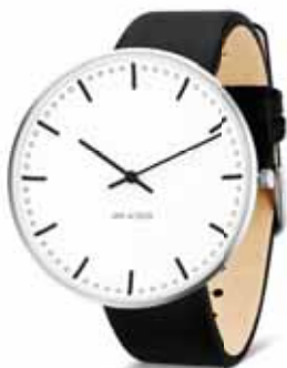
CITY HALL - 46 mm Lederband schwarz 53203-2201 € 269