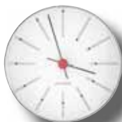
BANKERS - WANDUHR 120 MM 43688 | € 109