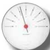
BANKERS - HYGROMETER 120 MM 43685 | € 109