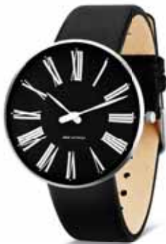
ROMAN BLACK - 40 mm Lederband schwarz 53305-2001 € 269