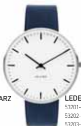
LEDERBAND NAVY BLAU

53201-1601 | 34 MM € 249 53202-2001 | 40 MM € 269 53203-2201 | 46 MM € 269