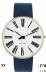
LEDERBAND NAVY BLAU