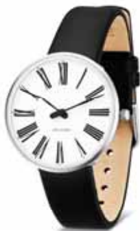
ROMAN - 34 MM Lederband schwarz 53301-1601 € 249