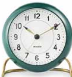
STATION 43677 | 110 mm € 109