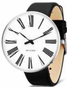
ROMAN - 46 mm Lederband schwarz 53303-2201 € 269