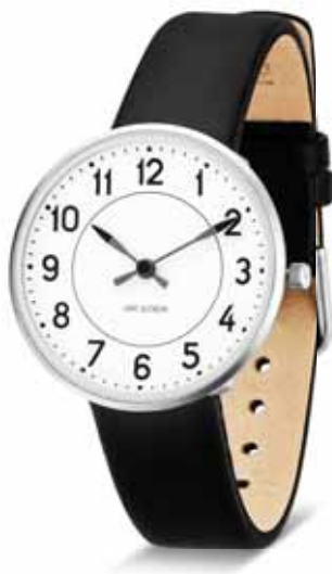
STATION - 34 mm Lederband schwarz 53401-1601 € 269