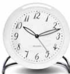
LK 43670 | 110 mm € 95