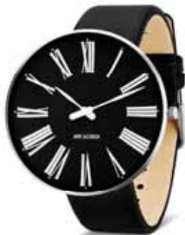
ROMAN BLACK - 46 mm Lederband schwarz 53306-2201 € 269