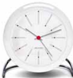
BANKERS 43675 | 110 mm € 95