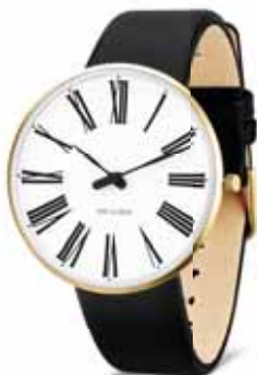
ROMAN GOLD - 40 mm Lederband schwarz 53308-2001 € 299