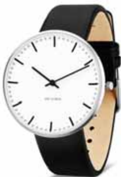
CITY HALL - 40 mm Lederband schwarz 53202-2001 € 269