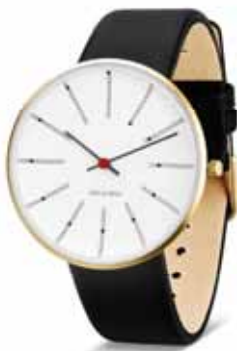
BANKERS GOLD - 40 mm Lederband schwarz 53108-2001 € 299