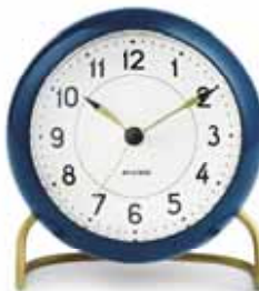
STATION 43678 | 110 mm € 109