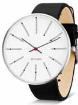
BANKERS - 46 mm Lederband schwarz 53103-2201 € 269