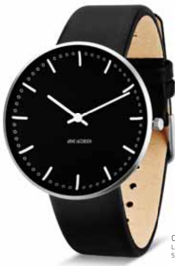
CITY HALL BLACK 40 MM Lederband schwarz 53205-2001 € 269