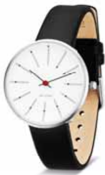
BANKERS - 34mm Lederband schwarz 53101-1601 € 249