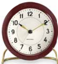
STATION 43676 | 110 mm € 109