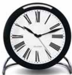
ROMAN 43671 | 110 mm € 95