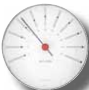
BANKERS - TERMOMETER 120MM 43687 | € 109