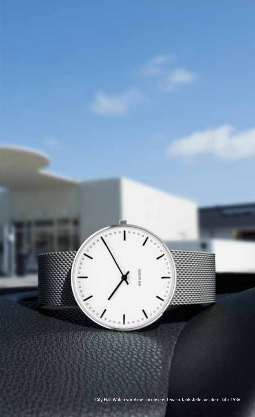
City Hall Watch vor Arne Jacobsens Texaco Tankstelle aus dem Jahr 1936