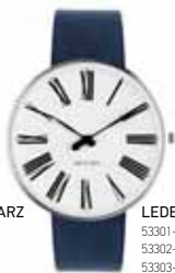
LEDERBAND NAVY BLAU

53301-1601 | 34 MM € 249 53302-2001 | 40 MM € 269 53303-2201 | 46 MM € 269