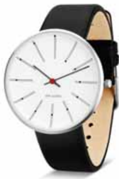
BANKERS - 40 mm Lederband schwarz 53102-2001 € 269