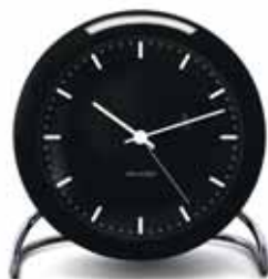
CITY HALL 43673 | 110 mm € 95