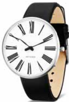
ROMAN - 40 mm Lederband schwarz 53302-2001 € 269