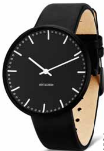
CITY HALL BLACK 40 MM Gehäuse IPB Lederband schwarz 53205B-2001 € 299