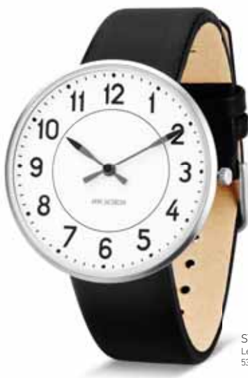
STATION - 40 mm Lederband schwarz 53402-2001 € 269