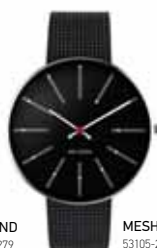
MESH-BAND SCHWARZ 53105-2010 | 40 MM € 299