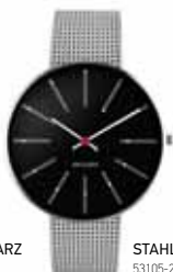
STAHL-MESH-BAND 53105-2008 | 40 MM € 279